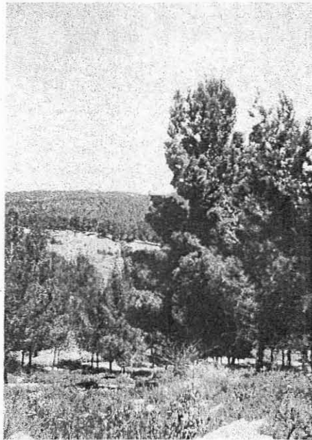
Abb. 2: Erstaufforstung mit Aleppokiefer in Israel auf einem ehemals verkarsteten Standort in Galiläa (aus RÖHLE, 1992).

Ansätze des erweiterten waldwachstumskundlichen Verständnisses zeigen auch